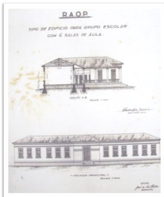
Figura 3: Modelo de fachada dos Grupos escolares com 6 salas.