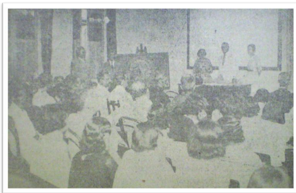
Aspecto da solenidade de inauguração das palestras rádio-educativas.